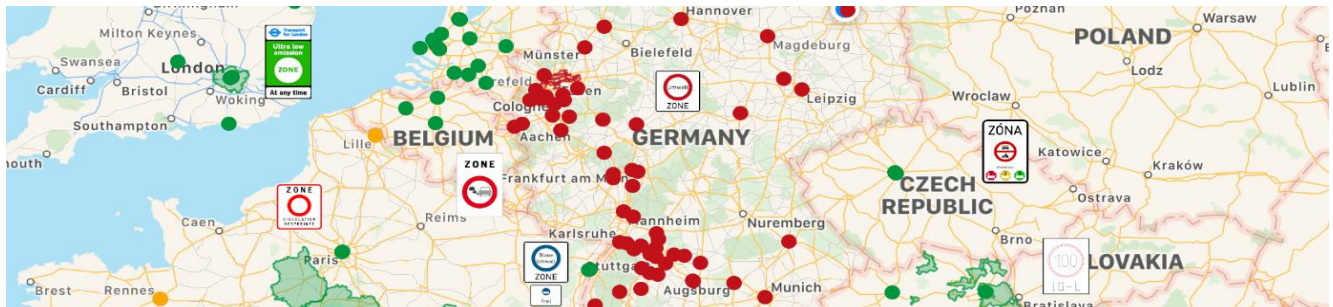
Agosto de 2019. Tabla: © Green-Zones.eu