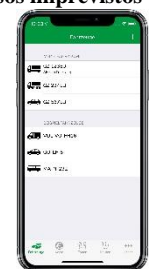
Gestión de vehículos