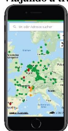
Visión general EU

Viajando a través de las zonas de bajas emisiones con la aplicación gratuita Green-Zones: No más sanciones y retrasos imprevistos