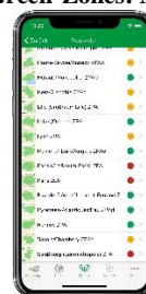
Todas las zonas por país