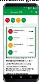
Valores del aire